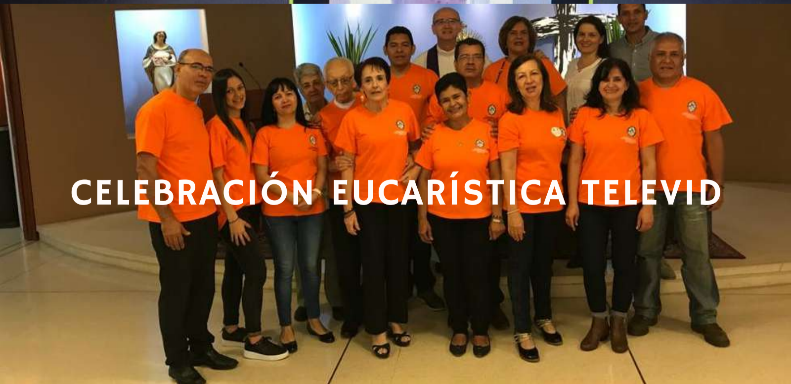
CELEBRACIÓN EUCARÍSTICA TELEVID