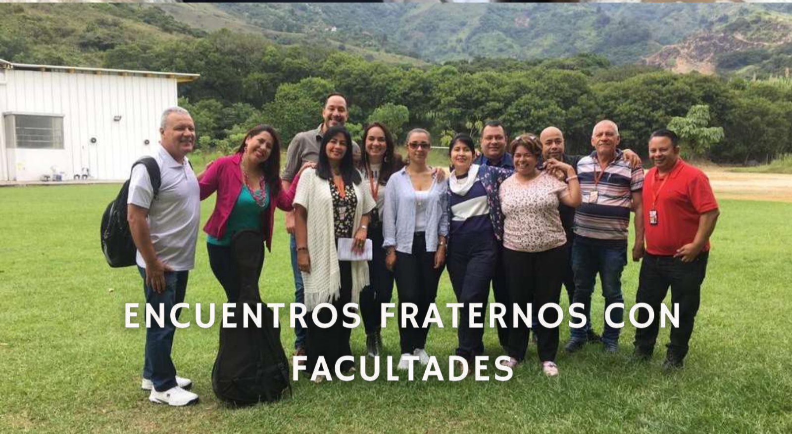
ENCUENTROS FRATERNOS CON FACULTADES