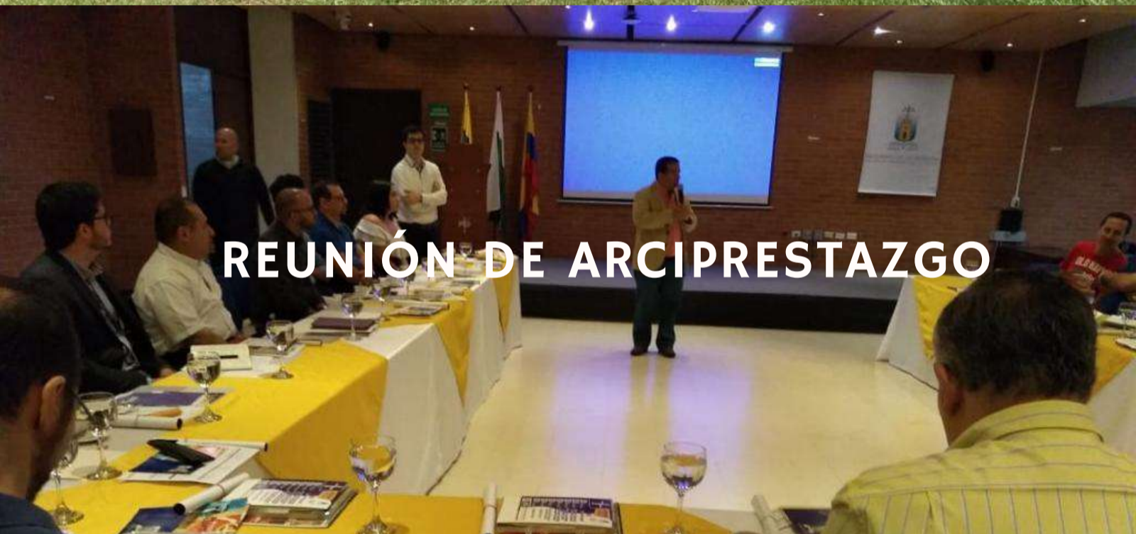
REUNIÓN DE ARCIPRESTAZGO