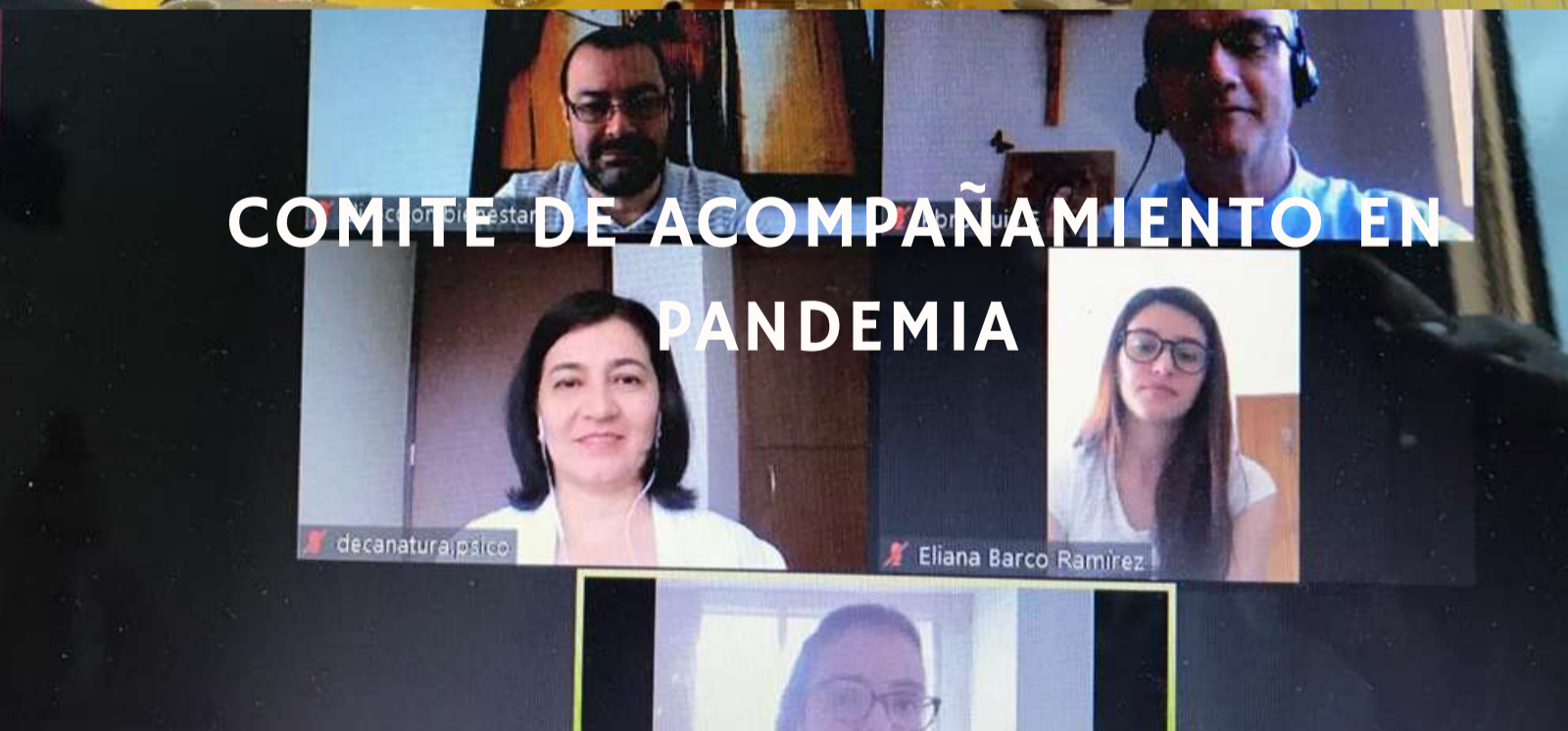
COMITÉ DE ACOMPAÑAMIENTO EN PANDEMIA